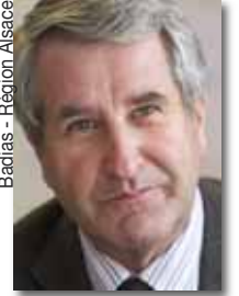
Badias - Région Alsace

Président du Conseil Régional d'Alsace. Il a occupé également les postes de Questeur du Sénat (2008-2010), Vice-président du Sénat (2004-2008), Sénateur du Bas-Rhin (1992-2010), Président du Conseil général du Bas-Rhin (1998-2008), Conseiller général du Bas-Rhin (canton de La Petite Pierre) (1982-2008) et Conseiller régional d'Alsace (1985-1992)